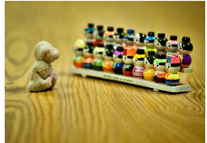
"Captive Audience"